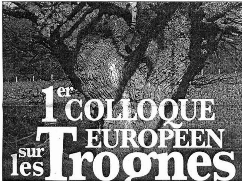
Cartel del primer congreso internacional de árboles trasmochos celebrado en Francia

En referencia a las prácticas tradicionales y en otros países europeos las ramas de los árboles trasmochos se utilizaban para explotarlos como alimento para la ganadería, mientras que en Teruel y Zaragoza, casos únicos en Europa, para la construcción al emplearse la madera para