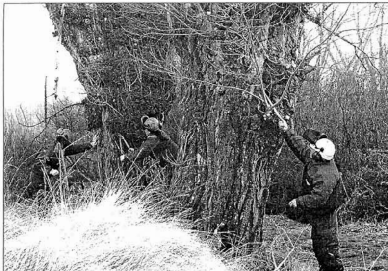
La labor de trasmochar los chopos cabeceros la realizan los alumnos desde el suelo por seguridad

da del chopo cabecero es en Pancrudo, Aguilar del Alfambra, El Pobo, Jorcas, Galve, Camarillas y Ababuj.