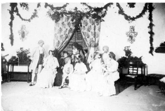
Año 1908. Baile dentro de la Casa Grande, organizado por la familia Pintado. Se pueden observar diversos trajes de época, procedentes del ropero de los Mateo, y la decoración del salón, muy al gusto de la hidalguía del siglo XVII.