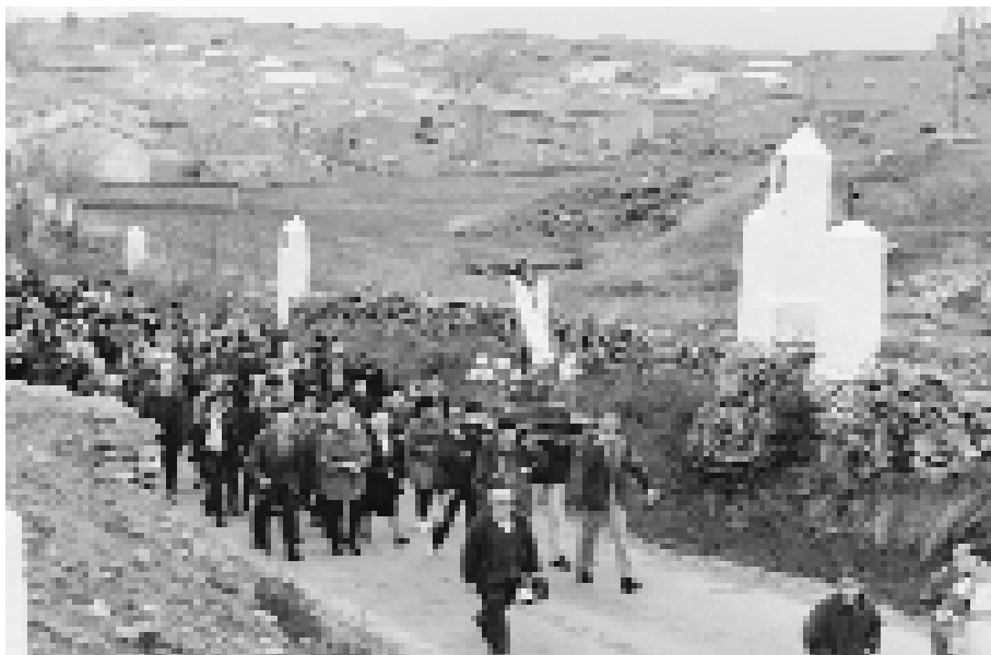
La procesión sale del pueblo hacia la ermita entonando cantos (mayo, 1998).

La romería que se realiza cada año en la llamada Fiesta de Santa Cruz se convierte en la festividad de conmemoración de lo más distintivo de la comunidad. Muchos mineros me recordaban que preferían no subir a trabajar ese día respetando así la festividad que les representa.