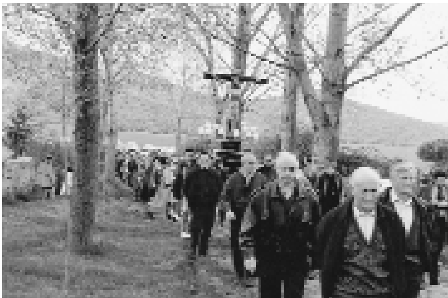
La procesión con su Santo entra en el paraje de Herrera donde se encuentra la ermita (1998).