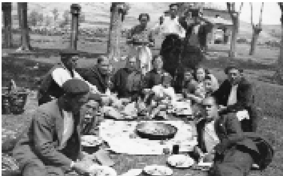
Comiendo en el Santo Cristo. Al fondo la ermita (década de los 40).

su Santo Cristo. También para los informantes esta manifestación se remonta hasta casi la eternidad, aunque como hemos visto el inicio de la leyenda tiene una fecha que pocos son capaces de localizar. El tiempo se convierte así en el argumento que refuerza y justifica los dispositivos de identidad. Es palpable el esfuerzo comunitario que se está llevando a cabo por establecer en el presente signos que llenen el sentir comunitario de nuevos bríos ante la decadencia que se avecina. El refuerzo y la recreación de la identidad puede impulsar a la comunidad hacia el futuro con esperanza, la devoción a su santo y los rituales en torno a él propiciados sirven de elemento aglutinador y cohesivo para todos los descendientes de la localidad que refuerzan su identidad en torno a su banda.