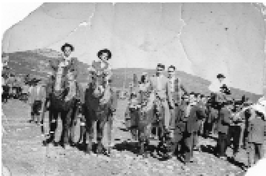
Los quintos con sus caballerías engalanadas en Herrera el día de Santa Cruz (década de los cincuenta).

Me ha parecido necesario profundizar en uno de los elementos que sobresalen y se nos muestran como recurrentes en la historia y memoria de Ojos Negros: la devoción a