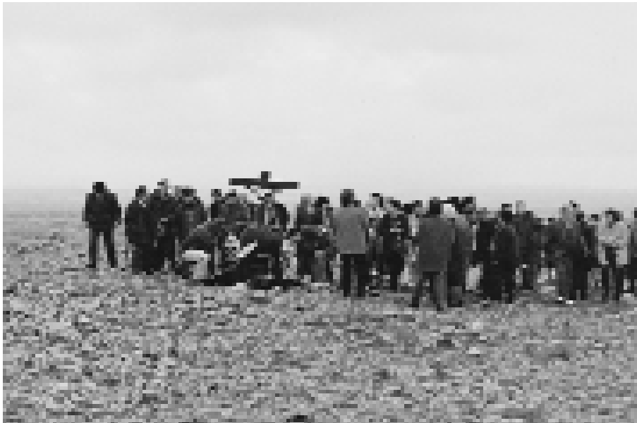
Los costaleros dejan al Santo en el suelo para que el sacerdote proceda a la bendición del término municipal en el Cerro de San Gregorio (1998).