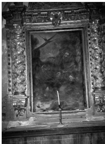
Altar de San Francisco. Ermita de Pelarda. 18-8-1993.