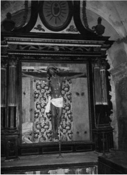
Altar del Cristo. Ermita de Pelarda. 18-8-1993.