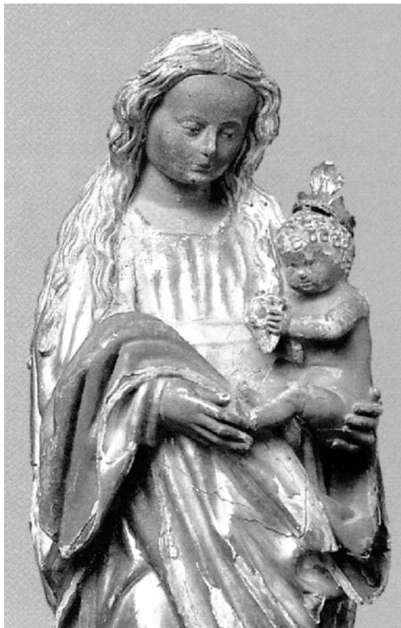
Virgen del Mar. Del libro La Virgen en el Reino de Aragón .

No en vano el P. Faci atribuye como primer milagro de Nuestra Señora de Pelarda “el conservarse la S. Imagen después de tantos siglos pintada, y quatro enterrada, sin lesión, y aquella tela de seda con la misma maravilla”. A lo que la tradición añade que al ser hallada la Imagen se llevó a Zaragoza “para que algún Pintor la retocase, pareciendo a algunos que por haber estado enterrada tantos siglos, avía perdido algo de su nativo esplendor, pero jamás pudo aquel retocarla en parte alguna; dando a entender María Santísima que estaba su S. Imagen con la misma perfección que tenía cuando salió de las manos de su primer artífice”.