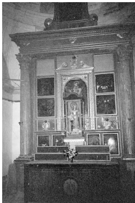
Altar de San Lorenzo (o de Santa Lucía, o de la Virgen de Pelarda). Ermita de Pelarda. 18-8-1993.