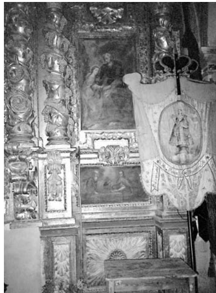
Altar Mayor. San Joaquín. Ermita de Pelarda. 18-8-1993.