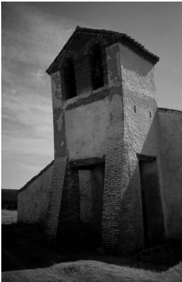
Ermita de Pelarda. Campanario. 18-8-1993.

buye la autoría de la obra a San Lucas (ESTA SANTA IMAGEN ES PINTADA POR MANOS DE SN LUQAS), tradición que se da con referencia a la Virgen de Pelarda. Para acabar por convencernos transcribimos del libro de las constituciones de la Cofradía: “Y en la Capilla Mayor, Ara y Cuerpo principal de su retablo, en un nicho de Talla, está colocado un quadro de pincel de la Soberana Virgen, puesta sobre un trono de Gloria coronada; y el infante Niño Jesús (vivo al parecer) en su diestra mano tan perfectamente acabado, y distinto de lo demás que su hermoso, modesto y grave rostro infunde devoción á los que con advertencia le contemplan, y atrae a sí los Corazones de todos”.