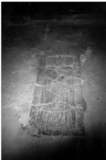
Lauda sepulcral. Ermita de Pelarda. 18-8-1993.

Guiadnos, Señora, al puerto seguro de tempestades.