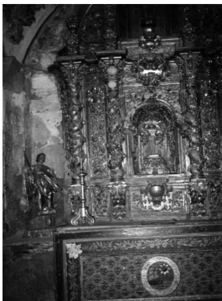
Altar de la Virgen del Mar. Ermita de Pelarda. 18-8-1993.