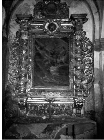
Altar de Las Almas. Ermita de Pelarda. 18-8-1993.