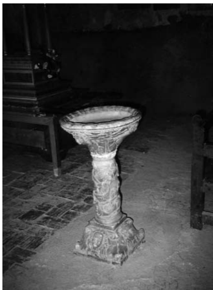
Pila del agua bendita. Ermita de Pelarda. 18-8-1993.