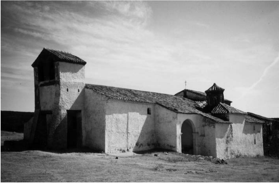
Ermita de Nuestra Señora de Pelarda. 18-8-1993.