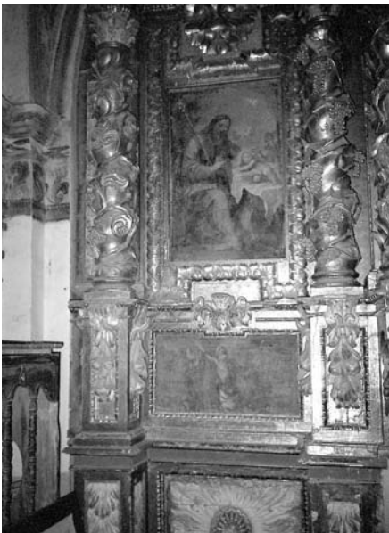
Altar Mayor. San José. Ermita de Pelarda. 18-8-1993.