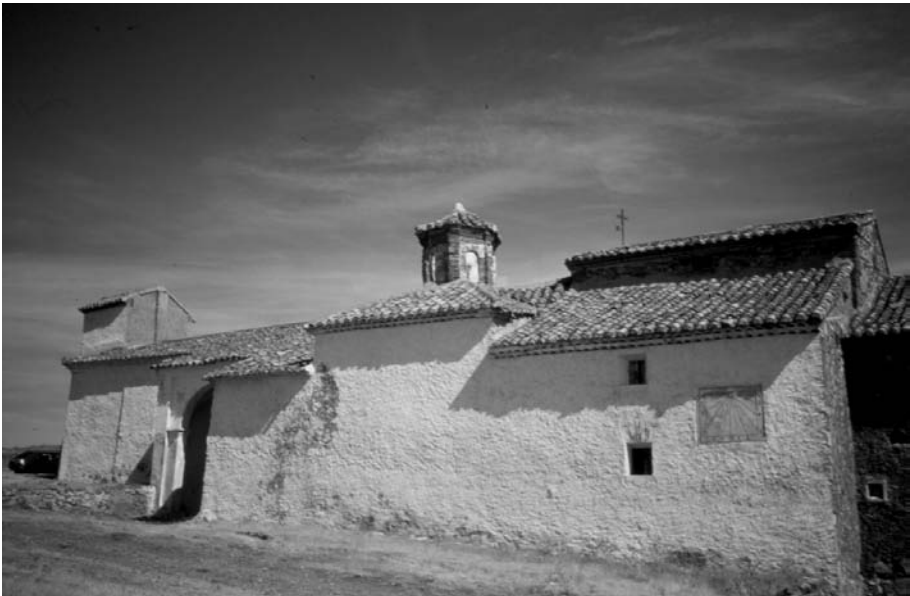
Ermita de Pelarda. Exterior. 18-8-1993.