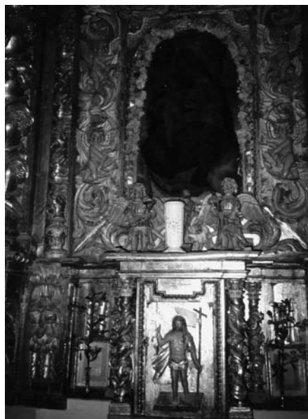
Virgen de Pelarda. Altar Mayor. 18-8-1993.