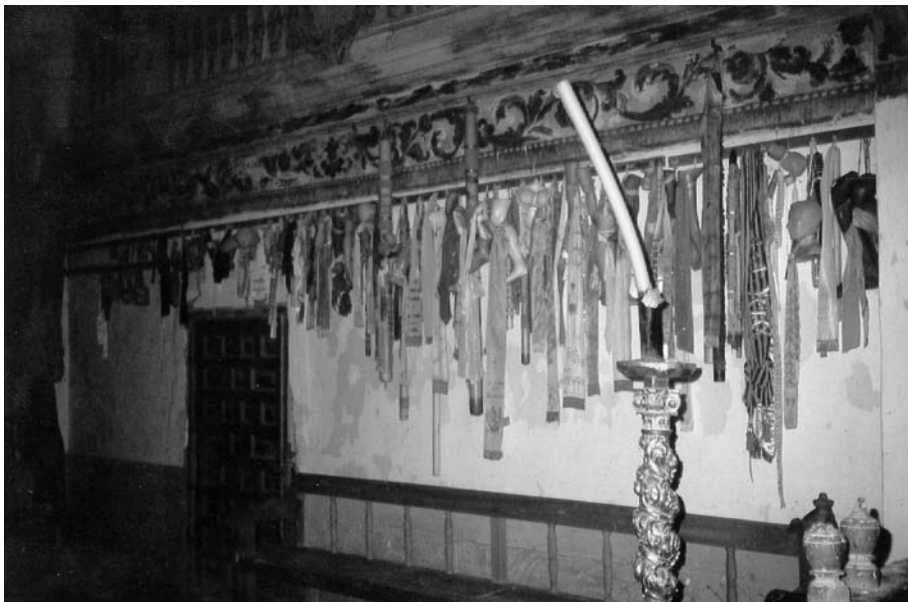
Ex-votos y ofrendas. Ermita de Pelarda. 18-8-1993.