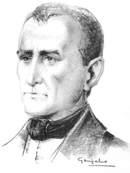
Ilustración. José Gonzalvo Vives