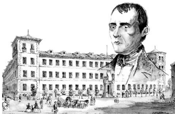
Ilustración. Jorge Laffarga Gómez