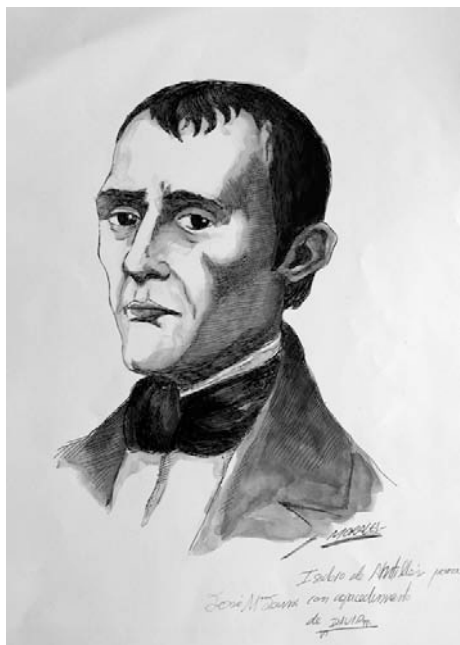
Ilustración. David Fernández Morales