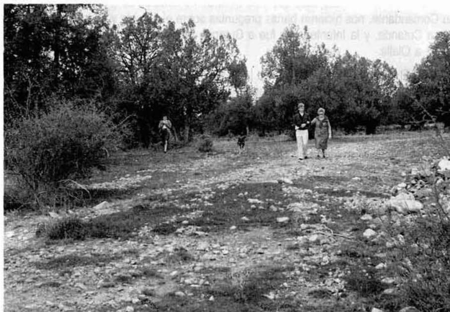
El Sabinar, otra ruta de llegada de los Franceses a Olalla. (Foto C. Nevot).