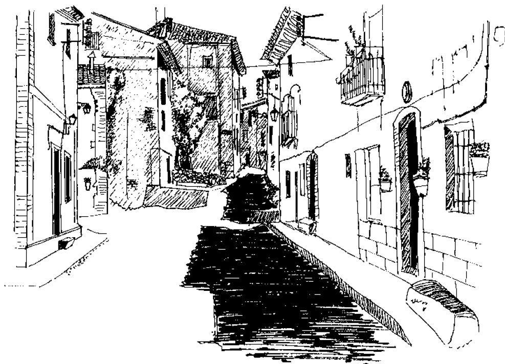
Torre los Negros