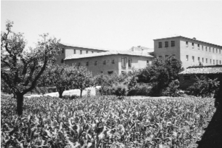
Panorámica del complejo monástico desde la fecunda huerta.