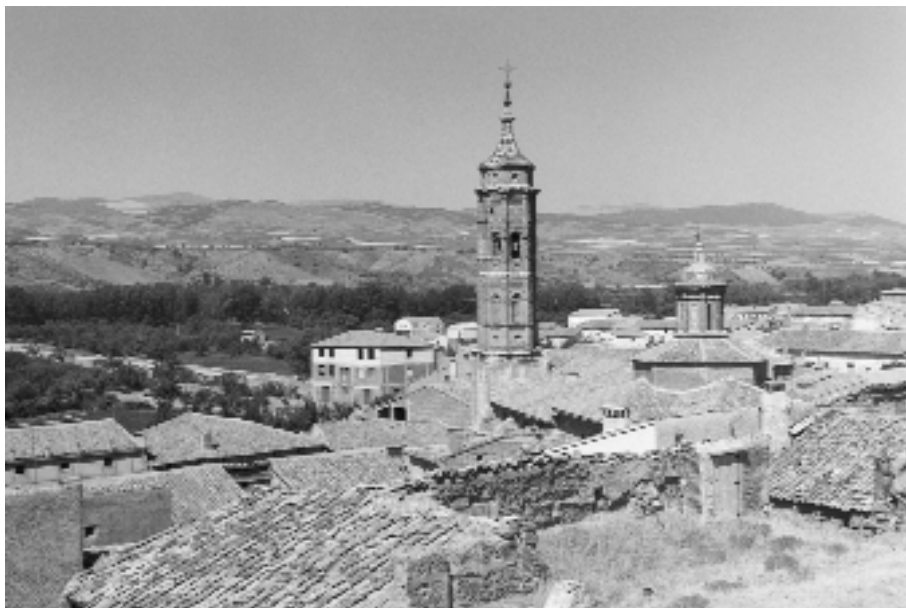
Bagüena. Vista panorámica.

ejemplo, inspecciones del término 1 , como en desplazamientos a Daroca u otros lugares 2 , incluso, a Zaragoza 3 . En estas ocasiones la cuantía fijada era el jornal vigente, que aumentaba en función del tiempo y la distancia en cierta cantidad en concepto de dietas.