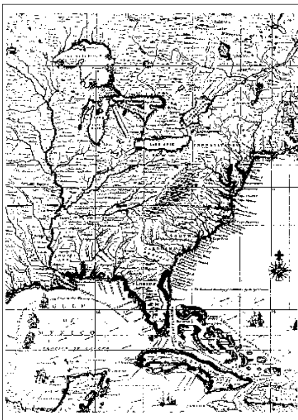
Cuenca del Misisipí, tomada del mapa de Henry Popple's de 1733. Dentro del territorio de la Luisiana.

que plantea claramente Carlos III, el monarca español firma el tercer Pacto de Familia y entra en la contienda bélica nuevamente al lado de Francia, pero con tan desfavorables resultados para las potencias borbónicas que España perdió La Habana y Manila, para cuya recuperación por la paz de París de 1763, debió ceder a Inglaterra la Florida, el fuerte de San Agustín y la bahía de Pensacola, obteniendo como compensación la Luisiana francesa.