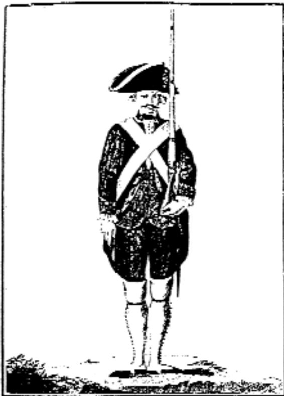
Soldado del Real Cuerpo de Artillería.

Como a casi todos los hijos ilustres de Blancas, su memoria nos viene de la mano del erudito Dr. Fernández Arraiza, quien al rescatarlo del olvido apenas aporta datos