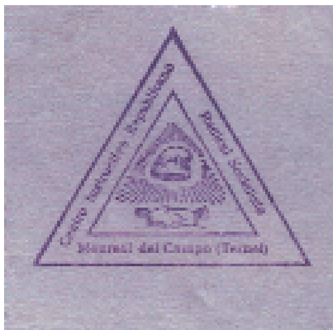
Cuño del CRRS de Monreal del Campo.

En núcleos urbanos de cierta consideración, adoptaron los casinos una filiación política añadiéndola al nombre con denominaciones como “liberal”, “conservador”, “republicano”, “radical”... lo que les singularizaba de otros que pudiera haber en la ciudad. En el caso del Jiloca, los casinos de la Comarca, salvo excepciones, no se decantaron por ninguno de ellos por lo que se puede hablar de que no existió una etiqueta política concreta. Ello no quiere decir que en los casinos no se hablase de política o que sus socios no mantuvieran una ideología similar, ya que eran centros influyentes que podían ejercer presión sobre los precarios ayuntamientos, cuya autoridad estaba mediatizada, a veces, por estas sociedades.