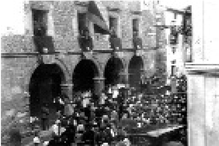
El ministro Irujo de visita a su localidad natal, Cella.