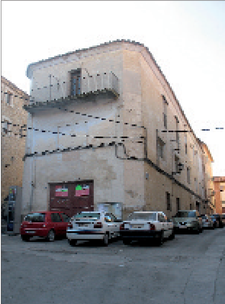
Sede de la Sociedad Obrera de Cella.